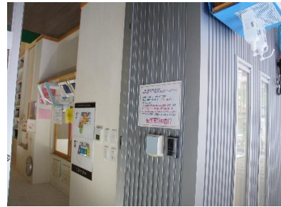
保育園入口 自動扉