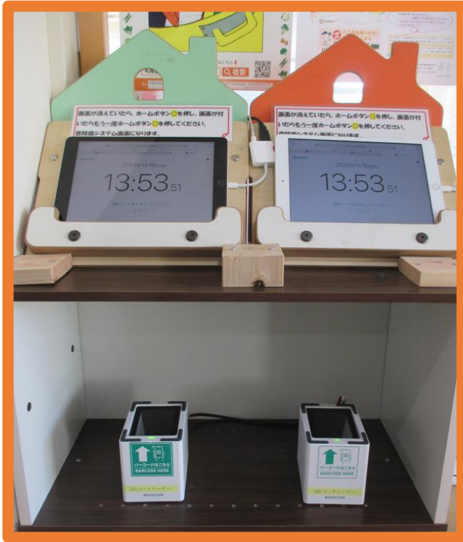
登降園時間打刻用 ipad