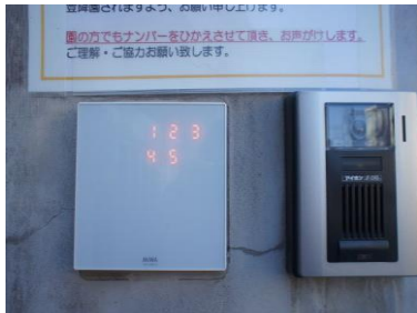
正面門扉 インターホン

白い画面は最初、数字は表示されませんので、軽く画面に触れて下さい。 次に数字が表示されますので、テンキーを押して解錠してから中にお入り下さい。 設置箇所は2ヶ所です。(同じ暗証番号です。) 画面に触れる度、テンキーの位置は変わりますが、暗証番号は変わりません。 お帰りの際は保育園の自動扉と門の出口付近に解錠ボタンがあります。 ご確認ください。(お子様には絶対に触れさせないで下さい。)